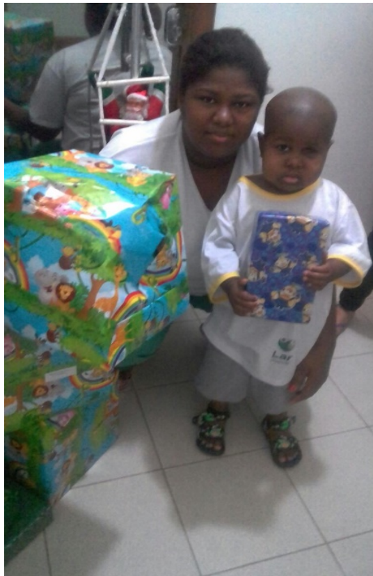
Festa de Natal