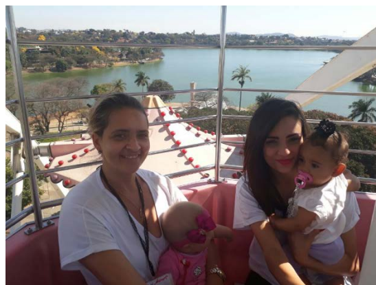
Passeio no Parque